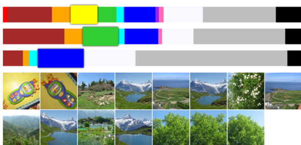
Figura 1: Exploração de imagens usando barras com distribuição das cores.

Para apresentar os resultados da interrogação, implementamos duas técnicas de visualização. A visualização por grelha de imagens segue o paradigma tradicional, onde os resultados são organizados como uma lista de itens na tela. Adicionalmente, criamos outra visualização de grelha, em que os resultados são arrumados mantendo as proporções e sem cortes. Outra técnica que desenvolvemos, dispõe as imagens ao longo de uma espiral, como ilustra a Figura 2. As imagens estão ordenadas do centro para o exterior – no centro estarão as imagens mais semelhantes ao exemplo. Além disso, as imagens mais próximas do centro terão dimensões maiores, ao passo que as imagens situadas no exterior da espiral terão dimensões mais reduzidas, reforçando a ordem pela qual se encontram.