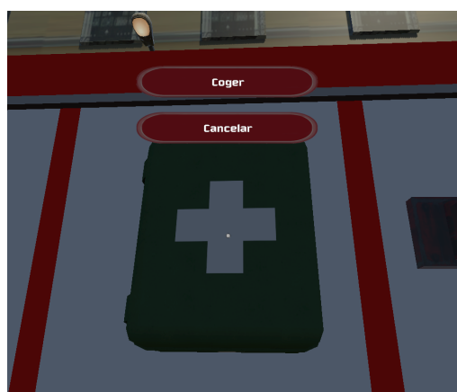
Figura 4: Menú sobre un objeto disponible en el camión de bomberos.

Las interficies implementadas para la comunicación con los agentes virtuales y la interacción con los objetos están basadas en menús contextuales que se activan cuando el usuario pulsa el ratón sobre el objeto o agente (ver Figura 4 y Figura 5). Las opciones de los menús se actualizan según las acciones que previamente ha realizado el jugador, por ejemplo, si a un bombero ayudante le asignamos la tarea "Apagar contenedor", esta opción de menú no aparecerá cuando seleccionemos a otro bombero para realizar otras tareas.