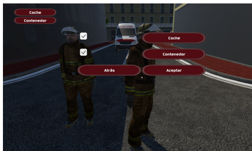
Figura 5: Menu contextual del ayudante.