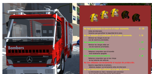
Figura 3: Recuento final de la puntuación conseguida

La puntuación máxima se calcula previamente para cada situación de emergencia a partir del camino óptimo que se debe seguir en el grafo y el tiempo mínimo que, según los expertos, hay que dedicar a resolver la situación de emergencia. Para mostrar la puntuación de forma atractiva se presenta al jugador un rango de cascos de bombero iluminados total o parcialmente (ver Figura 3).