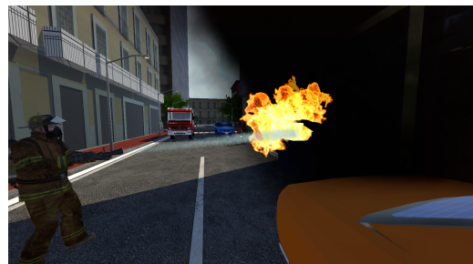
Figura 1: Un bombero ayudante.

El jugador puede realizar muchas acciones con los objetos y agentes virtuales: coger objetos, hablar con personas, comunicar por radio, dar órdenes a los bomberos ayudantes (ver Figura 1), abrir puertas, usar la manguera para apagar fuego, usar la palanca o el botiquín, arrastrar a una víctima hasta llevarla a la ambulancia, etc... Algunas acciones se pueden ejecutar utilizando las teclas y otras a través de menús de opciones.